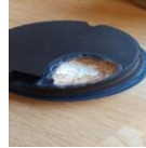
Kapotte dop koffiekkan